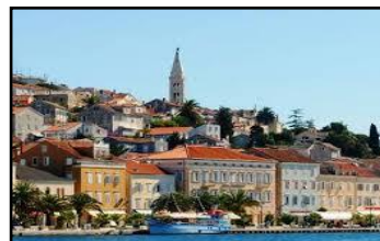
Župa Rodenja B.D.Marije