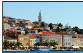
Župa Rodenja B.D.Marije