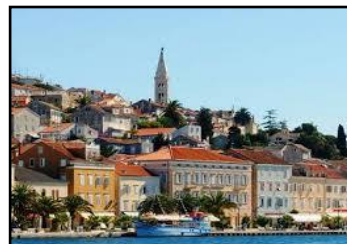
Župa Rodenja B.D.Marije