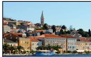
Župa Rodenja B.D.Marije