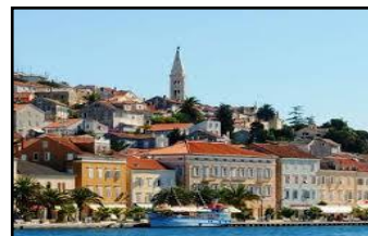
Župa Rođenja B.D.Marije